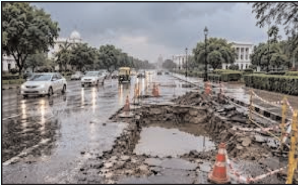
महानगर मेट्रो व्यूरो