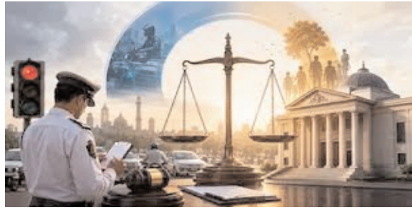
महानगर मेट्रो व्यूरो

नई दिल्ली। दिल्ली में लाखों लंबित ट्रैफिक चालानों से परेशान वाहन चालकों के लिए राहत भरी खबर है। अब लोगों को चालान निपटाने के लिए कामकाजी दिनों में कोर्ट के चक्कर नहीं लगाने पड़ेंगे। दिल्ली पुलिस ने घोषणा की है कि 5 जुलाई 2026 से राजधानी के सभी जिला अदालत परिसरों में 'वीकेंड कोर्ट' शुरू किए जाएंगे। यह कदम उन लोगों को ध्यान में रखकर उठाया गया है जो नौकरों या अन्य कारणों से सप्ताह के दिनों में अदालत नहीं पहुंच पाते। दिल्ली में हजारों ट्रैफिक चालान और नोटिस लंबित हैं, जिन्हें तेजी से निपटाने के लिए यह नई व्यवस्था शुरू की जा रही है।