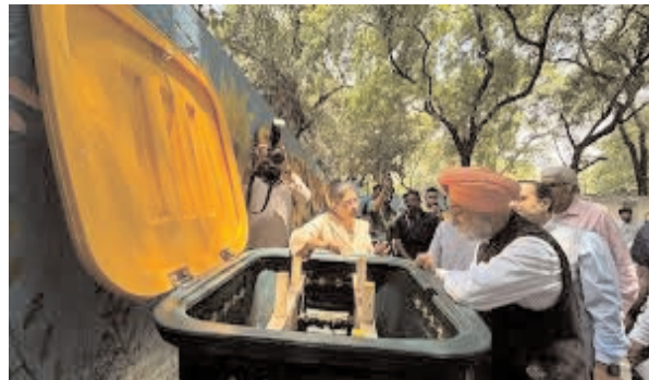
महानगर मेट्रो व्यूरो

दिल्ली। उपराज्यपाल तरनजीत सिंह संधू ने नवजीवन विहार की जीरो-वेस्ट कॉलोनी का निरीक्षण कर पूरे शहर में इस मॉडल को लागू करने का निर्देश दिया है। इस अनूठे मॉडल से स्थानीय स्तर पर ही कचरे का निपटारा कर गाजीपुर, भलस्वा और ओखला जैसे लैंडफिल साइट्स के कचरे के पहाड़ों को कम किया जाएगा। दिल्ली की पहचान आज सिर्फ देश की राजधानी के रूप में नहीं, बल्कि कचरे के पहाड़ों वाले शहर के रूप में भी होती जा रही है। गाजीपुर, भलस्वा और ओखला के लैंडफिल साइट्स लगातार बढ़ते कचरे के बोझ से जूझ रहे हैं। ऐसे समय में नवजीवन विहार का दौरा कर यहां संचालित 'जीरो-वेस्ट तरनजीत सिंह संधू ने नवजीवन विहार का दौरा कर यहां संचालित 'जीरो-वेस्ट कॉलोनी' मॉडल का निरीक्षण किया। दौरे के बाद उन्होंने नगर निगम को निर्देश दिया कि इस मॉडल को राजधानी के अन्य इलाकों, विशेषकर अनधिकृत और निम्न आय वर्ग की कॉलोनीयों में भी लागू करने की दिशा में काम किया जाए। दिल्ली हर दिन लगभग 11,862 टन ठोस कचरा पैदा करती है। हालांकि, इसका एक बड़ा हिस्सा प्रोसेस किया जाता है, लेकिन हजारों टन कचरा अब भी लैंडफिल साइट्स तक पहुंचता है। नतीजा ये है कि शहर के कूड़े के पहाड़ लगातार ऊंचे होते जा रहे हैं और पर्यावरणीय खतरा बढ़ता जा रहा है। विशेषज्ञों का मानना है कि केवल बड़े प्रोसेसिंग प्लांट्स के भरोसे इस समस्या का समाधान संभव नहीं है। कचरे का निपटान उसी स्थान पर करना जहां वह उत्पन्न होता है, अधिक प्रभावी और टिकाऊ समाधान माना जाता है। यही अवधारणा 'जीरो-वेस्ट कॉलोनी' मॉडल का आधारशिला है।दक्षिण दिल्ली की नवजीवन विहार कॉलोनी के निवासी पिछले करीब आठ वर्षों से कचरे के पृथक्करण, कम्पोस्टिंग और रीसाइक्लिंग को व्यवस्था चला रहे हैं। यहां घरों से