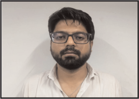
महानगर मेट्रो ब्यूरो

3000 रुपये की रिश्तव लेते जूनियर वलक गिरफ्तार