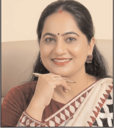
लीक तोड़ने का साहस

अफ्रीका की ‘वोदाबे’ जनजाति: यहाँ पुरुष महिलाओं को रिझाने के लिए घंटों चेहरे पर अनोखा मेकअप करते हैं, आँखों में काजल लगाते हैं और सुंदर कपड़े पहनकर नृत्य करते हैं, जहाँ महिलाएँ जज बनकर अपने लिए वर चुनती हैं।