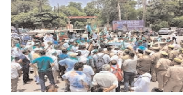
महानगर मेट्रो ब्यूरो