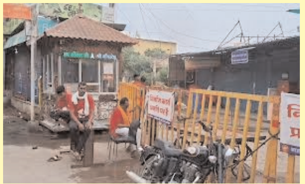
महानगर मेट्रो ब्यूरो