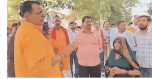
महानगर मेट्रो ब्यूरो