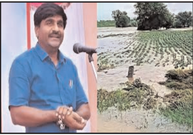
अनुमान का बेसब्री से इंतजार कर रहे हैं।