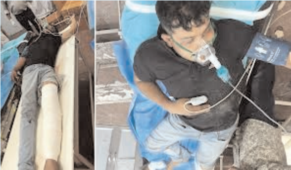
महानगर मेट्रो व्यूरो