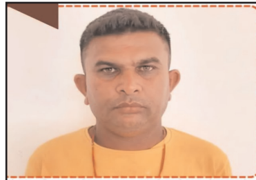
महानगर मेट्रो ब्यूरो

शराबबंदी की गतिविधियों को खत्म करने के लिए अपनी जांच के दौरान एक बड़ी कामयाबी मिली है।