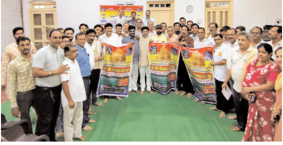
महानगर मेट्रो ब्यूरो

18 जुलाई को 2500 तीर्थरक्षक करेंगे गिरनार कूच - सकल समाज का ऐतिहासिक संकल्प