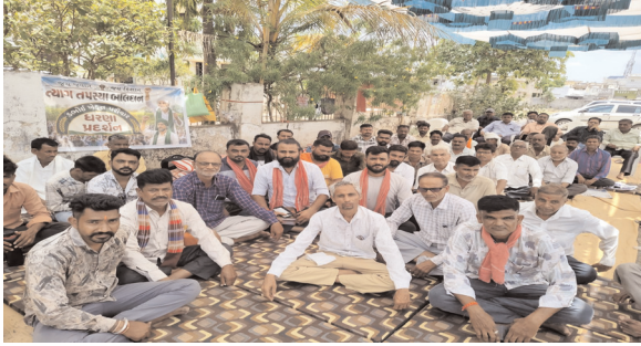
महानगर मेट्रो ब्यूरो

उमोई में फूड डिस्ट्रीब्यूटर का गुस्सा: बार-बार बदलते सरकारी नियमों के खिलाफ चौथे दिन भी विरोध जारी