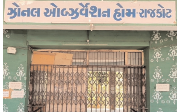
महानगर मेट्रो ब्यूरो

भागे 11 बच्चों में से 7 कुछ ही घंटों में मिल गए, 4 बच्चे अभी भी एडमिनिस्ट्रेशन और पुलिस की पकड़ से बाहर हैं