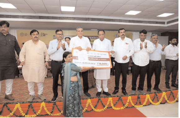
महानगर मेट्रो ब्यूरो

गवर्नर्स की तरफ एक ओर कदम: A.M. कॉर्पोरेशन ने साउथ और ईस्ट ज़ोन के लोगों के लिए 'जन कल्याण शिविर' लगाया