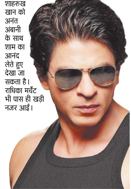
शाहरुख खान को अनंत अंबानी के साथ शाम का आनंद लेते हुए देखा जा सकता है। राधिका मर्चेंट भी पास ही खड़ी नजर आईं।

एक ही फ्रेम में नजर आए शाहरुख और रणवीर इसी चर्चा के बीच, मुंबई में हुई एक हाई-प्रोफाइल जन्मदिन पार्टी की एक तस्वीर सामने आई है। यह पार्टी एक आलीशान होटल में हुई। इस पार्टी में फिल्म जगत की हस्तियों और राजनीतिक हस्तियों का मेल देखने को मिला। तस्वीर में, शाहरुख खान और रणवीर सिंह दोस्तों के एक ग्रुप के साथ पोज देते हुए नजर आ रहे हैं। तस्वीर में जहां कई लोग खड़े हैं वहीं रणवीर सिंह बैठकर पोज दे रहे हैं। शाम का आनंद लेते नजर आए शाहरुख ग्रुप फोटो के अलावा, पार्टी के अंदर का एक और वीडियो भी ऑनलाइन वायरल हो रहा है। इसमें