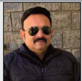
पवन माकन ग्रुप एडिटर

अंतरराष्ट्रीय प्रवासन संगठन के अनुसार, यह संकट अब ईरान की सीमाओं से बाहर भी फैल चुका है। 19 मार्च तक अस्सी हजार से अधिक लोग देश छोड़ चुके हैं। इनमें से सबसे ज्यादा लोग अफगानिस्तान पहुंचे हैं, जहां सत्तर हजार से अधिक लोगों ने शरण ली है।