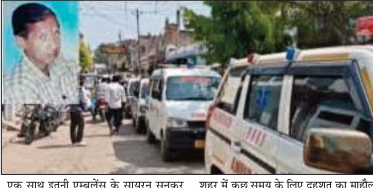
एक साथ इतनी एम्बुलेंस के सायरन सुनकर शहर में कुछ समय के लिए दहशत का माहौल