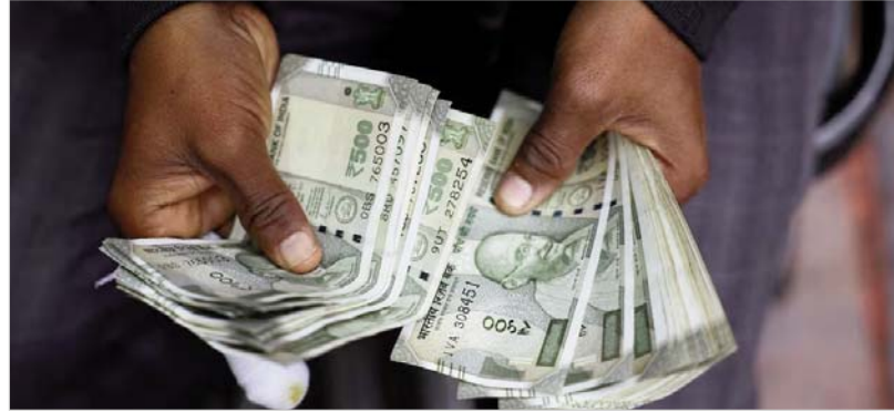
करीब एक साल में रुपए में डॉलर के मुकाबले में करीब 12 रुपए की गिरावट देखने को मिल चुकी है। इंटरबैंक फॉरिन एक्सचेंज में, रुपया 93.62 पर खुला और फिर अमेरिकी डॉलर के मुकाबले और मजबूत होकर 93.57 पर पहुंच गया, जो पिछले बंद स्तर से 128 पैसे की बढ़त थी। शुरुआत में, रुपया 89 पैसे की भारी गिरावट के साथ अमेरिकी डॉलर के मुकाबले 94.85 के ऐतिहासिक निचले स्तर पर बंद हुआ था।

लेवल के साथ लाइफ टाइम लोअर लेवल पर कारोबार करता हुआ दिखाई। जानकारों की मानें तो आने वाले दिनों में रुपए में और भी गिरावट देखने को मिल सकती है। डॉलर के मुकाबले में रुपए में और गिरावट देखने को मिल सकती है। दिन के ह्रास से 2.33 रुपए गिरा रुपया आंकड़ों को देखें तो रुपए में डॉलर के मुकाबले में काफी गिरावट देखने को मिल चुकी है। आंकड़ों के अनुसार रुपया 93.247 के लेवल के साथ मजबूत हो गया था। लेकिन कारोबारी सत्र के दौरान रुपए में डॉलर के मुकाबले में 2.33 रुपए की गिरावट देखने को मिली और आंकड़ा 95.58 के लेवल पर पहुंच गया। खास बात तो ये कि